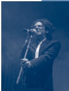
La voz de Café Tacuba.

Durante el evento, esta sociedad informó que en el último semestre se han pagado 186 millones de pesos por derechos a socios nacionales, sociedades extranjeras y foráneas ■