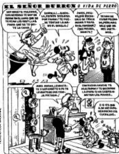
El señor Burrón o Vida de perro, Pepín, 1949.

bargo, por sus prematuras inclinaciones artísticas, se adivinaba en él algo diferente.