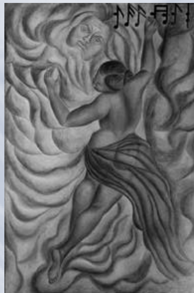
La música (2.50 m x 1.73 m).